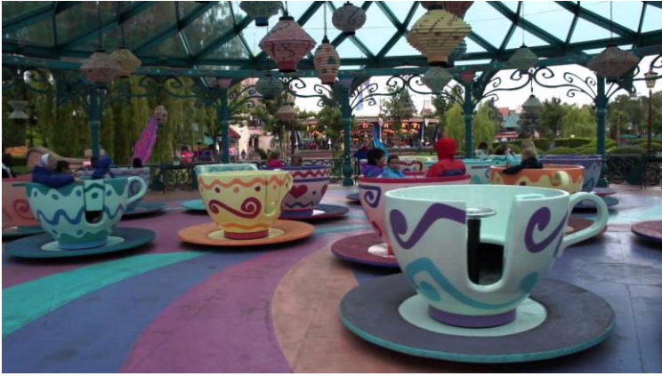
Mad Tea Party